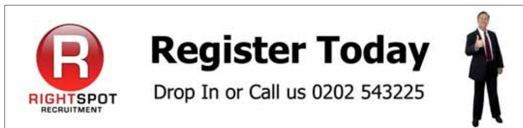
Banery o wymiarach maksymalnych 215 x 1200 mm