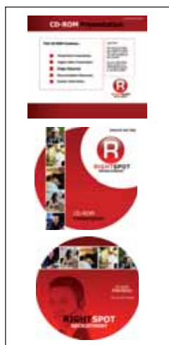
Rozwiązania na płyty CD