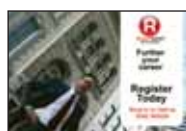
Kartki pocztowe A6